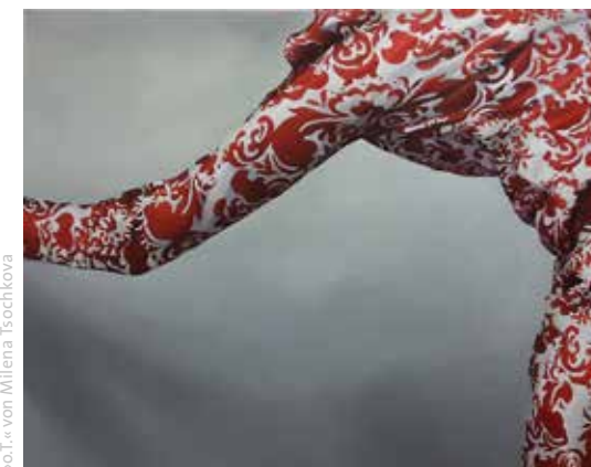
»0.I.« von Milena Tsochkova