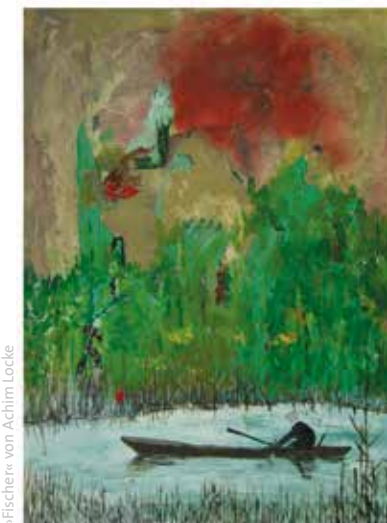
»Fischer« von Achim Locke