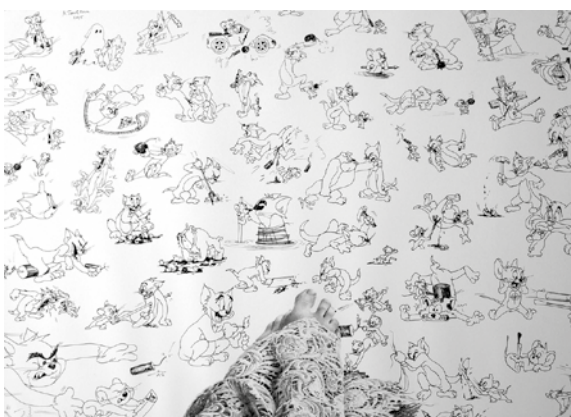
»Mordshunger« von Milena Tsochkova