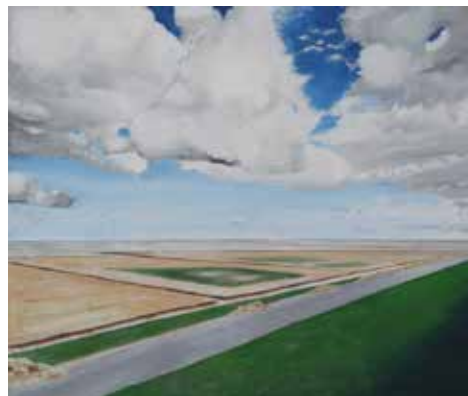
»Nordsee« von Achim Locke